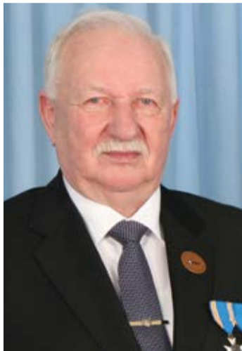
Väner Lootsmann Loksa linnapea