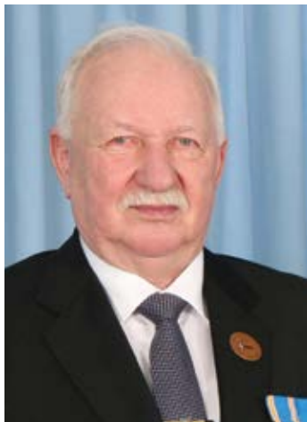
Варнер Лоотсманн Мэр Локса