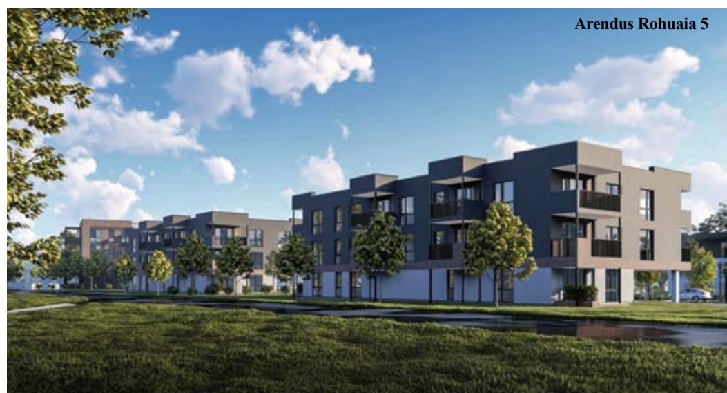
Arendus Rohuaia 5

В последние годы город Локса проводил различные переговоры, чтобы найти девелопера, который также смог бы реализовать желания. Я считаю, что к сегодняшнему дню мы нашли такого девелопера в виде Larvik Capital . Сегодня Larvik Capital приобрела несколько объектов недвижимости и инициировала несколько амбициозных проектов развития, направленных на оживление местной общины и экономики. Строительство многоквартирных домов, таунхаусов, частных домов и самого современного СПА в Эстонии придаст новое дыхание экономической жизни и досугу города Локса.