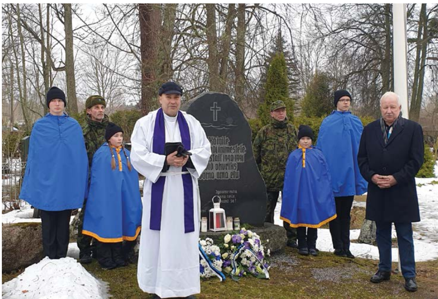
Lokslased 24.02.2024 tähistamas EV 106. aastapäeva Loksa kirikuaias.

Отмечая день рождения Эстонского государства, мы чтим память создателей нашего государства и уважаем то, что они сделали. Это наш долг. 24 февраля 1918 года родилась Эстонская Республика, 24 февраля 2024 года нашей стране исполнилось 106 лет. Развитие страны было полно воли и действий, ошибок и камней преткновения.