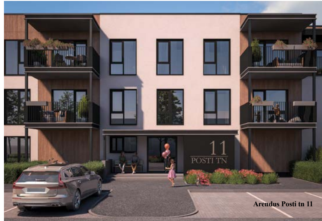
Arendus Posti tn 11