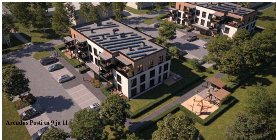
Arendus Posti tn 9 ja 11