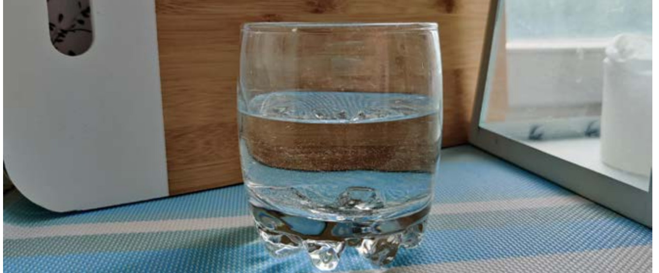
Цены на коммунальные услуги водоснабжения и канализации в городе Локса и в районах, прилегающих к городу. Цены на 06.02.2024г.