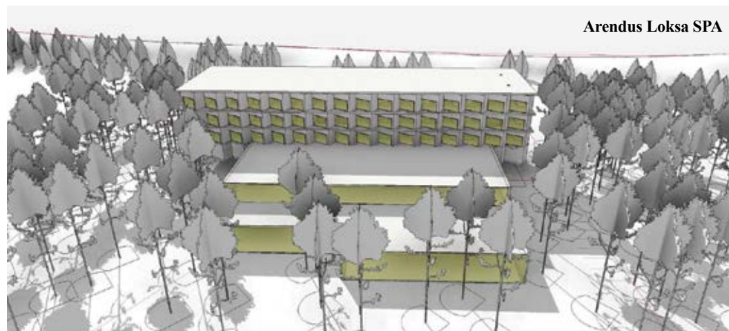
Arendus Loksa SPA