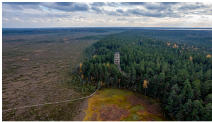
Majakivi matkarada.