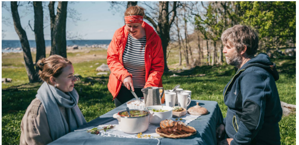
На прибрежном лугу Таммисту в День Лахемаа можно отправиться в поход и попробовать баранину в горшочке.